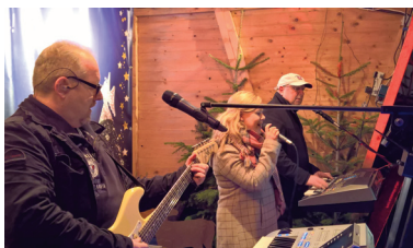
Two Step - Trio