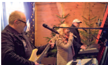
Two Step - Trio