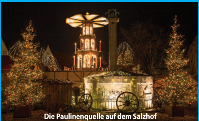
Die Paulinenquelle auf dem Salzhof

Wählen Sie die schönste Weihnachtsstadt. Danke für Ihre Stimme!